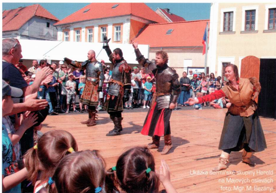
Ukázka sermiřské skupiny Herold na Májových oslavách

Zpravodaj Obecního úřadu Radonice ■ X. ročník, číslo 2 ■ (červen 2012)